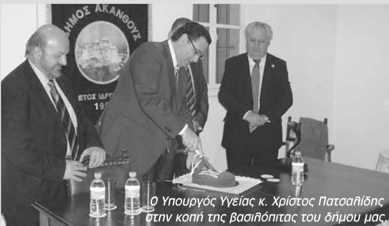
Ο Υπουργός Υγείας κ. Χρίστος Πατσαλίδης στην κοπή της βασιλόπιτας του δήμου μας.

Την βασιλόπιτα έκοψε ο Εντιμος Υπουργός Υγείας κ. Χρίστος Πατσαλίδης, στην παρουσία του δημάρχου Αγίου Αθανασίου κ. Κυριάκου Χατζητοφή, του δημάρχου Γερμασόγειας κ. Γαβριηλίδη και πολλών Ακανθιωτών που διαμένουν στη Λεμεσό, ικανοποιώντας και ένα δικαιο αίτημά τους, ότι πρέπει δηλαδή να γίνονται