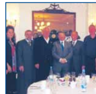
Συνάντηση Δημάρχου με Αμερικανική Επιτροπή σελ. 4