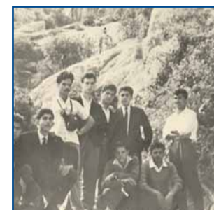
Φωτογραφικό ρετρό σελ.8