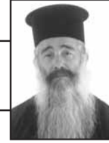
Οικονόμος Πέτρος Πέτρου Θεολόγος

Παρά το ότι επέλεξε το μοναχισμό ο Νικόδημος, υπήρξε πολύ δραστήριος. Ως εργόχειρο του είχε την αντιγραφή κωδίκων. Διατηρούσε αλληλογραφία με πολλούς λογίους της εποχής του και ιδιαίτερα με τον Οικουμενικό Πατριάρχη και εθνομάρτυρα Γρηγόριο Ε' και τον όσιο Αθανάσιο τον Πάριο. Ως μοναχός συνέταξε μεγάλο αριθμό συγγραμμάτων και βιβλίων που γίνετε εμφανής η ορθόδοξος θεολογία. Στόχος του ήταν μια δυναμική απόκρουση των αιρέσεων και των κακοδοξιών των ημερών του. Είναι η