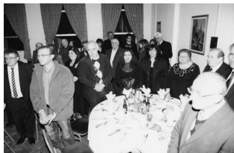
Στιγμιότυπο από τους παρευρισκόμενους της εκδήλωσης