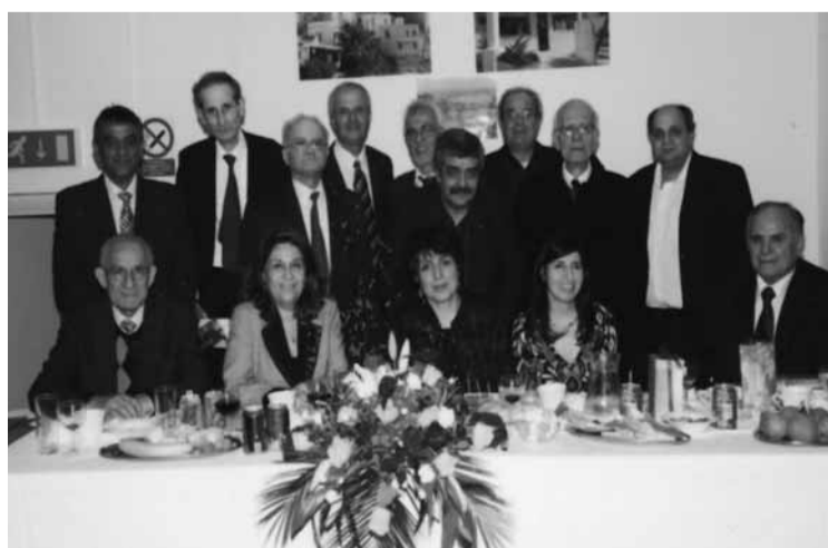
Μέλη της Επιτροπής Αγγλοακανθού με μέλη της Διοικούσης Επιτροπής της ΣΠΕ Ακανθούς σε αναμνηστικό στιγμιότυπο

Η Συνεργατική Πιστωτική Εταιρεία Ακανθούς, επιχορήγησε μεγάλη συνεστίαση των Ακανθιωτών Βρετανίας στις 12 Φεβρουαρίου 2011, φέρνοντας τους ξενιτεμένους Ακανθιώτες πιο κοντά. Στη συγκέντρωση, που διοργανώθηκε με τη βοήθεια του Σωματείου Αγγλοακανθού στο Κυπριακό Κοινοτικό Κέντρο, παρευρέθησαν και εκτός Λονδίνου διαμένοντες Ακανθιώτες. Στην εκδήλωση παρευρέθηκε και ο Επίσκοπος Τροπαίου, Αθανάσιος, ο οποίος σε χαιρετισμό του επαινέσε το έργο των Ακανθιωτών ευχόμενος περαιτέρω επιτυχίες.