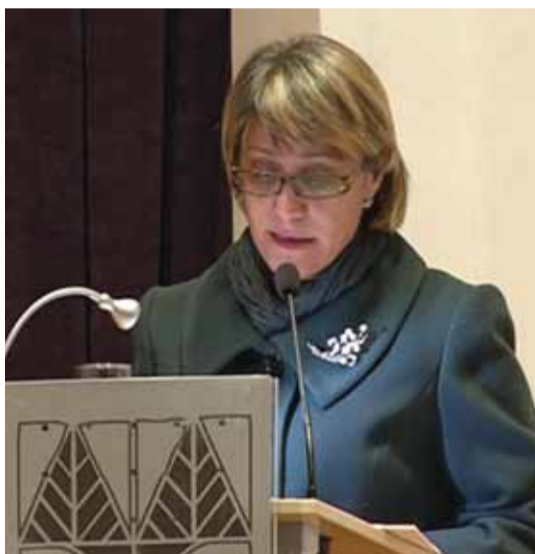
Η Υπουργός Εργασίας και Κοινωνικών Ασφαλίσεων κα Σωτηρούλα Χαραλάμπους