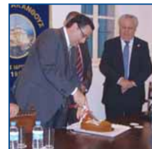
Κοπή Βασιλόπιτας Ακανθιωτών σελ. 3

Όλοι έφυγαν συγκινημένοι αλλά και αποφασισμένοι να εξακολουθήσουν να τηρούν τα ήθη, τα έθιμα και τις θρησκευτικές παραδόσεις της κωμόπολής μας στην προσφυγιά μέχρι την απελευθέρωση της Κύπρου και την επιστροφή στην ευλογημένη γη της Ακανθούς.