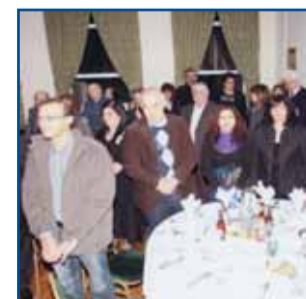
Συνεστίαση Ακανθιωτών στο Λονδίνο σελ.10