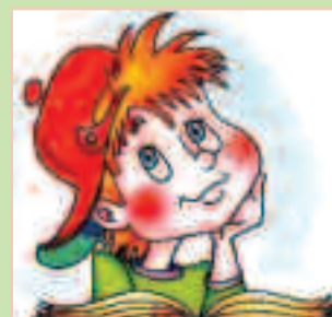
Η σελίδα του παιδιού σελ. 8