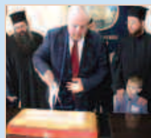
Κοπή βασιλόπιτας σελ. 1