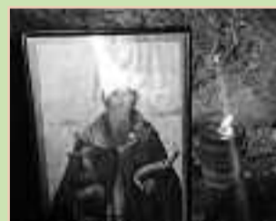
Άγιος Μίκαλος σελ. 7