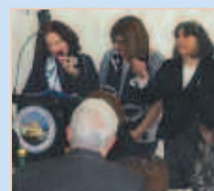
Κοπή βασιλόπιτας σελ. 3