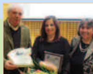
Γιορτή των Γραμμάτων σελ. 3